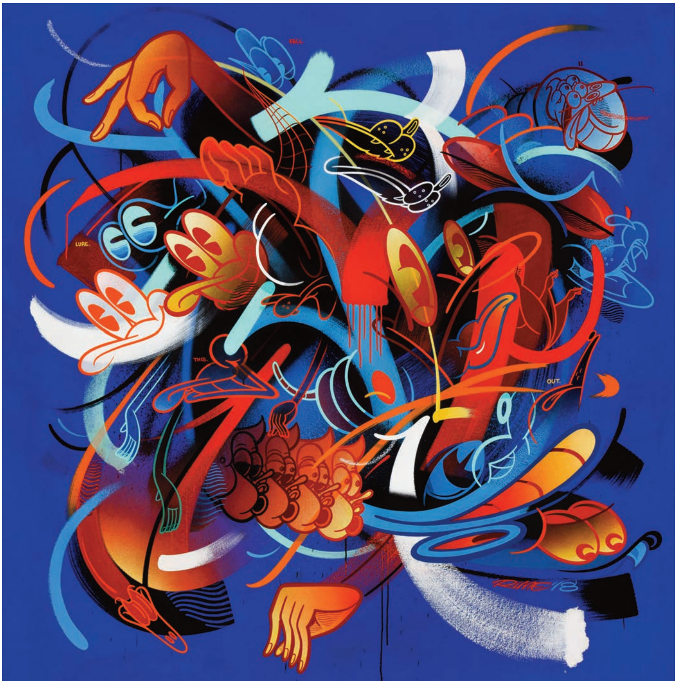
RIME , Venture Through the Lure of This Fall Out , 2018, acrylique et marqueur à l'huile sur toile, 168 x 160 cm

Ses œuvres en deux dimensions semblent surgir du mur tant par le mouvement des lignes et des formes qui la composent que par l'abondance foisonnante de leurs détails qui permettent à l'œil de régulièrement en découvrir un aspect insoupçonné jusqu'alors. A la manière d'une chanson qu'on croyait connaître et dont le sens apparaît tout à coup, les œuvres de Rime se regardent, se lisent et s'approprient avec le temps.