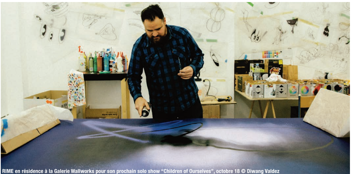
RIME en résidence à la Galerie Wallworks pour son prochain solo show "Children of Ourselves", octobre 18

We make to remember who we are and where we come from. When you go deep enough it becomes evident that we are the constant flux of a singular energy recreating itself. » Rime, octobre 2018