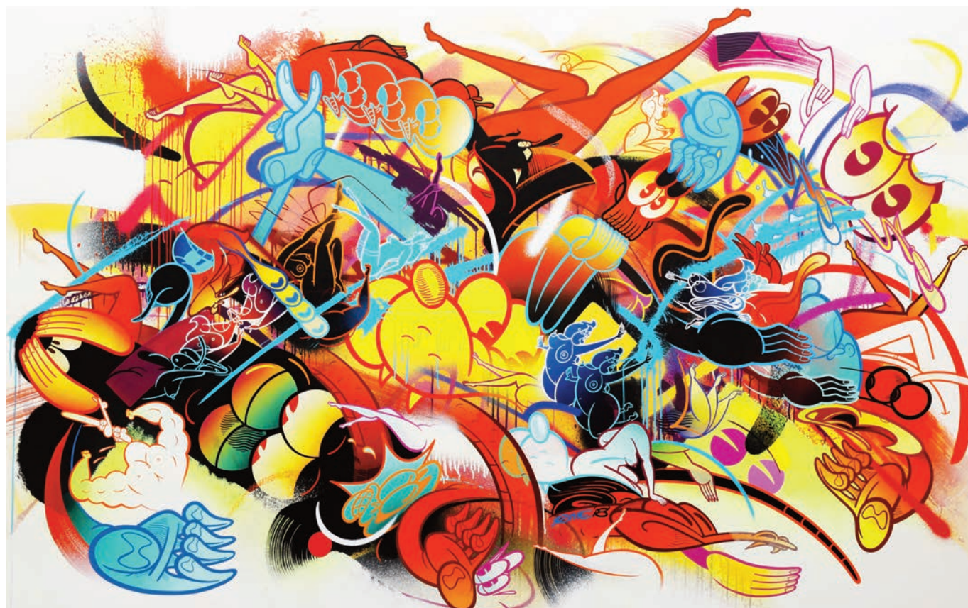
RIME , From the Beginning , 2018, acrylique, encre aérosol et marqueur à l'huile sur toile, 173 x 273 cm © Nicolas Giquel

A la manière d'un journal de bord, Rime conçoit ses œuvres comme une illustration de ce qu'il éprouve au moment où il les crée. Pour préparer son quatrième solo show à Paris lors de sa résidence de deux mois à la Galerie Wallworks, il s'est nourri de l'énergie de la ville pour traduire sur toile ce qu'il ressent du monde qui l'entoure et dans lequel il prend ses marques. Rime commence toujours par peindre une trame graphique réalisée à l'instinct selon l'urgence du geste du graffeur. A cette composition abstraite, il ajoute son propre vocabulaire – « I use a cartoon look as my way of being able to express ideas that are often subconscious. It's a language. » – pour exprimer ce qu'il perçoit de l'humain et de sa place dans un tout en perpétuel mouvement de pure énergie.