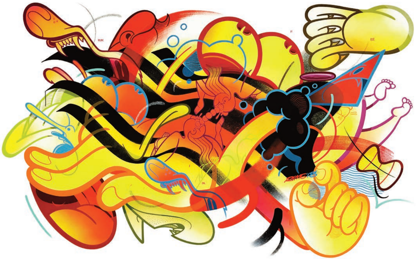
RIME, Nursery , 2018, acrylique et marqueur à l'huile sur toile, 194 x 304 cm © VIK NYC