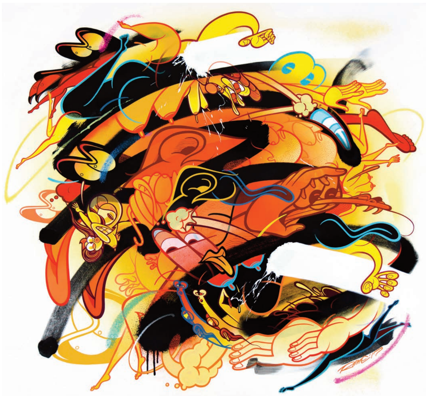
RIME , Up Turn to Fold , 2018, acrylique sur toile, 132 x 142 cm

Aujourd'hui établi à New York, c'est son quatrième solo show en France à la Galerie Wallworks.