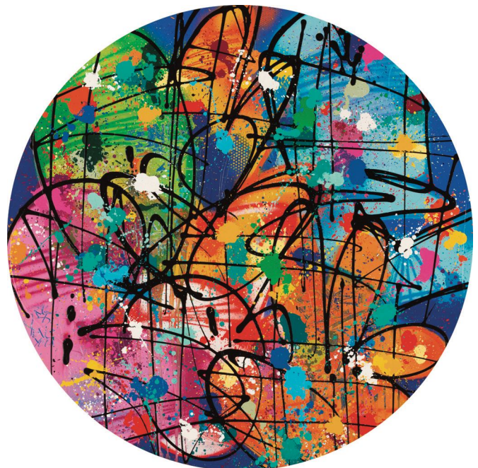
NEBAY , River Circle , 2021, acrylique et encre aérosol sur toile ronde, 120 x 120 cm © Alain Smilo