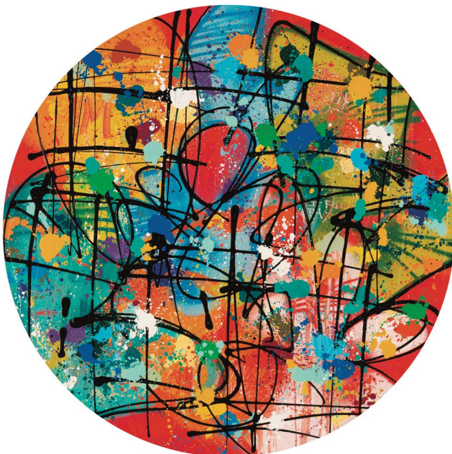
NEBAY , Fire Circle , 2021, acrylique et encre aérosol sur toile ronde, 120 x 120 cm © Alain Smilo

C’est au début des années 2000, lors d’un voyage initiatique de plusieurs mois à travers le monde, que se produit le déclic : aller au bout de ses rêves, voir grand. Ses lectures, rencontres et la découverte des pays qu’il traverse – Russie, Mongolie, Chine, Vietnam, Cambodge, Laos et Thaïlande – lui font prendre conscience du monde qui l’entoure et de ce qu’il souhaite laisser comme trace. De retour en France, il provoque sa chance et change de vie pour devenir artiste à part entière.