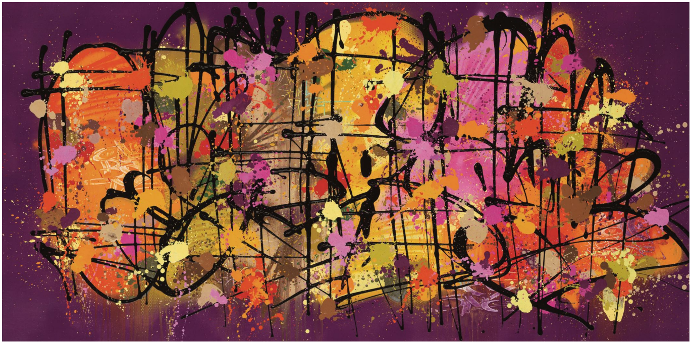
NEBAY , Bienvenue chez le fleuriste , 2021, acrylique et encre aérosol sur toile, 97 x 195 cm

Graffeur parisien depuis plus de 30 ans, avide de créations murales, Nebay commence à graffer en 1987 dans les rues de Paris et intègre le collectif JCT – Je Cours Toujours à 100 à l’heure. Né en 1973, Nebay est un artiste de rue qui s’inscrit dans son temps et investit son environnement : la ville. Il aime dire qu’il est « un jardinier du béton qui fait pousser de la couleur ».