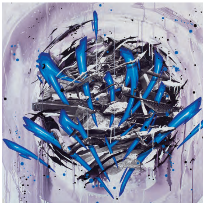
KATRE , K-Circle Serie , 2015, impression sérigraphique et acrylique sur toile, 100 x 100 cm © Alain Smilo

Curator : Claude Kunetz, Galerie Wallworks, 4 rue Martel 75010 Paris, www.galerie-wallworks.com