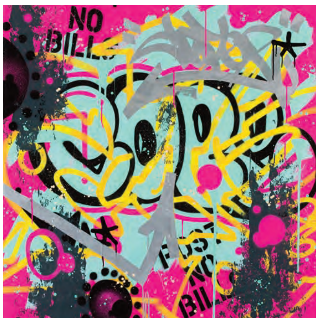
COPE2 , Sans titre , 2015, encre aérosol et acrylique sur toile, 100 x 100 cm © Alain Smilo

Un format commun à tous (une toile de 100 x 100 cm) et une carte blanche laissée à l'inspiration de chacun ; 83 artistes font don de leur œuvre qui sera vendue lors d'enchères organisées par Artcurial, maison de vente pionnière dans l'urban art. L'intégralité des sommes récoltées sera reversée à Emmaüs pour financer des projets d'aide aux populations en grande précarité, en France et dans le monde.