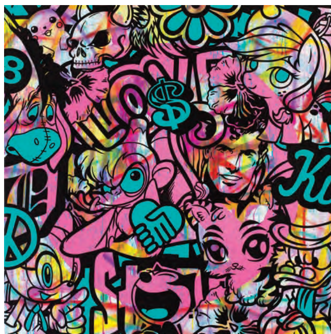
SPEEDY GRAPHITO , Timeless , 2015, encre aérosol et acrylique sur toile, 100 x 100 cm