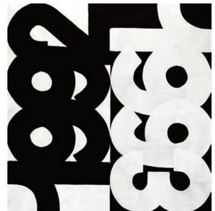
Eric HAZE, Sans titre , 2015, acrylique sur toile, 147 x 147 cm © Eric Haze