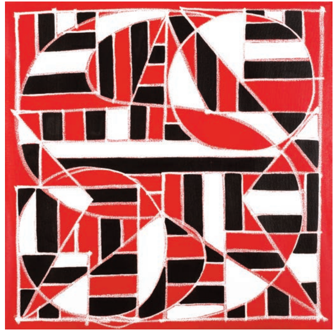
Eric HAZE, Sans titre , 2015, acrylique sur toile, 76.5 x 76.5 cm

La répétition – au sens de réitération – a toujours fait partie du vocabulaire d’Eric Haze, de ses premiers pas lorsqu’il s’employait à graffer son nom dans les rues de New York, à sa production artistique et à son activité de designer diffusée à l’international.