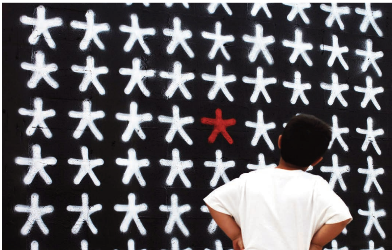
HAZE, Sans titre , 2013, "Graffuturism", Art Basel Miami