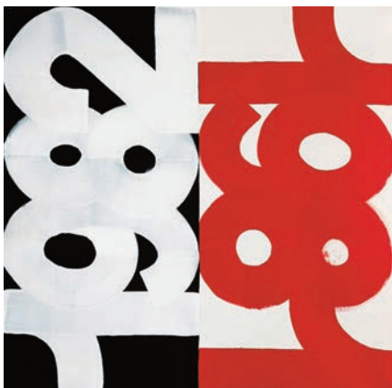
Eric HAZE, Sans titre , 2015, acrylique sur toile, 147 x 147 cm © Eric Haze

Conçues avec une économie de couleurs, les œuvres de Haze ont une dimension “immédiate” et portent en elles la mémoire du geste et de la rapidité d’exécution qu’implique l’exercice du graffiti en extérieur. A la croisée de la peinture, du graffiti et du design graphique, "Reflex Memories" traduit un élan vital inscrit dans l’ADN de l’artiste et basé sur son instinct.