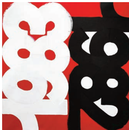
Eric HAZE, Sans titre , 2015, acrylique sur toile, 147 x 147 cm © Eric Haze