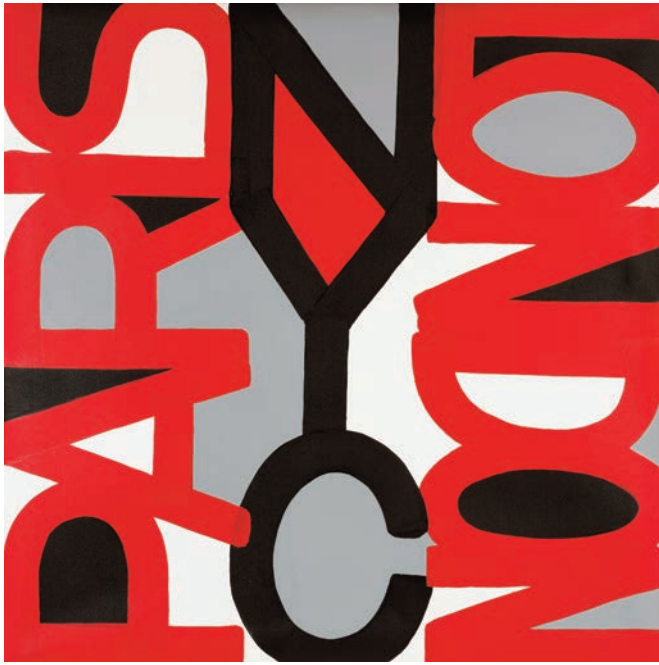
Eric HAZE, Sans titre , 2015, acrylique sur toile, 121 x 121 cm © Alain Smilo